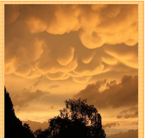
Hemerocallis-Beete, gemütliches Zusammensein unter der Pergola, die seltenen Mammatus-Wolken